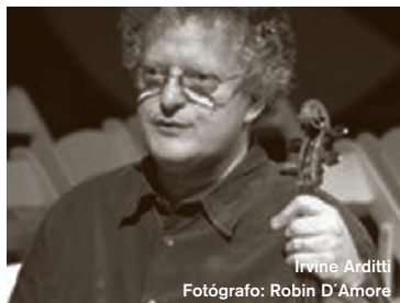
Irvine Arditti