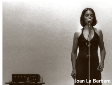
Joan La Barbara