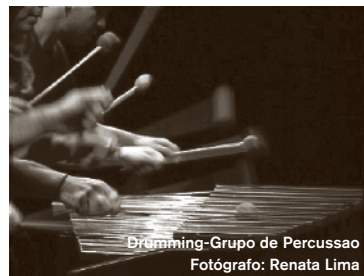
Drumming-Grupo de Percussao