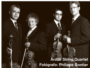
Arditti String Quartet